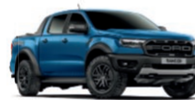
Ford Bleu Performance Peinture métallisée* (Ranger Raptor uniquement)