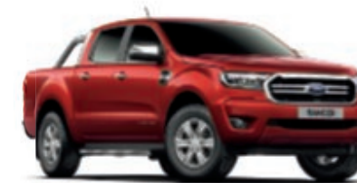
Rouge Cuivre Peinture métallisée* 1) *