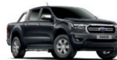
Noir Shadow Peinture de carrosserie Mica*