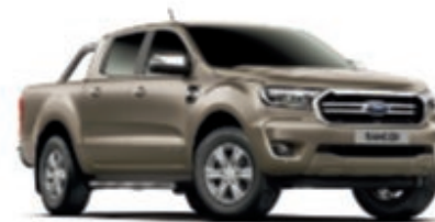
Gris Millenium Peinture métallisée* 1) *