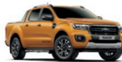
Orange Sabre Peinture métallisée* (Wildtrak uniquement)