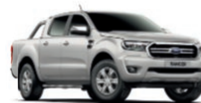
Gris Lunaire Peinture métallisée*