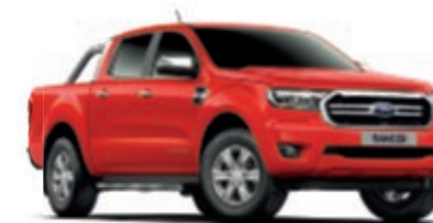
Rouge Colorado Peinture non métallisée (Sauf Wildtrak)