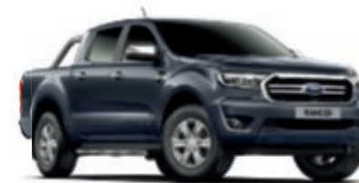
Gris Basalte Peinture métallisée* (Sauf Raptor)