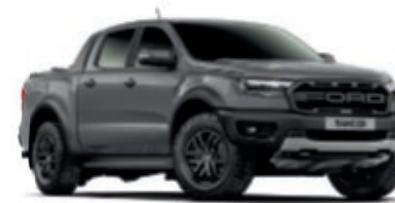
Gris Conquer Peinture non métallisée (Ranger Raptor uniquement)