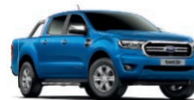
Bleu Lightning Peinture métallisée* 1) *