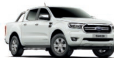
Blanc Glacier Peinture non métallisée